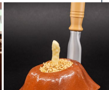
El Accésit al mejor Pincho Con Alimentos de Valladolid ha sido para Café - Bar Papiro y su "La Lola nos Lleva al huerto".