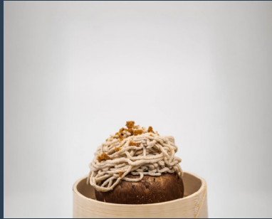
Mejor Pincho Postre: JIAPAN con su propuesta "Eclair Doce-3".