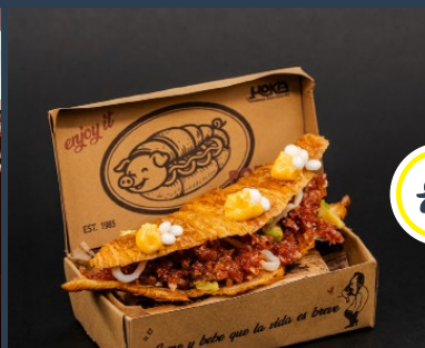
El Accésit a mejor concepto pincho lo ha ganado Moka con su propuesta "Porky Smash Castellano"