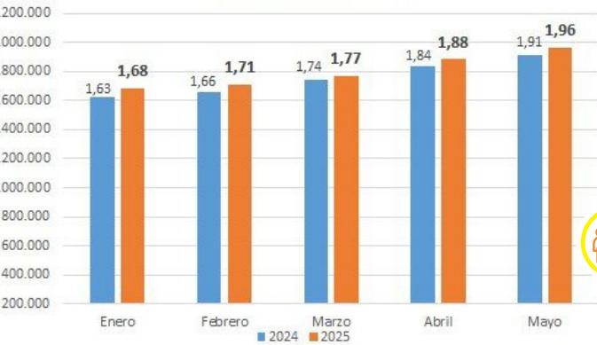
Trabajadores afiliados alta Seguridad Social Hostelería Años 2024-2025. Millones