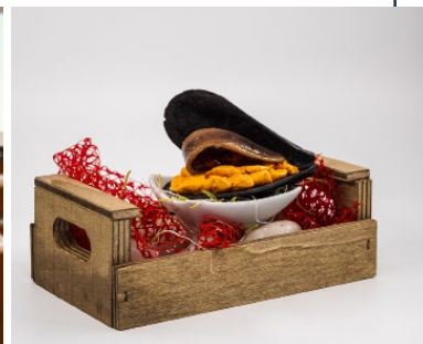
El premio al establecimiento más votado por el público al pincho "El Ilustre Mejillón" del establecimiento Los Ilustres.