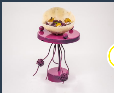
El Mejor Pincho Sin Gluten lo ha ganado RíoLuz Gastronomía con "Los Espaguetis del Milenio".