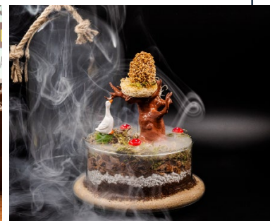
El Accésit al Pincho más Vanguardista ha sido para Ubi la Vega con "Evocaciones".