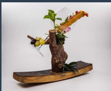
El Accésit al Pincho más Tradicional para Ángel con su propuesta "Entre fogones y Viñedos".