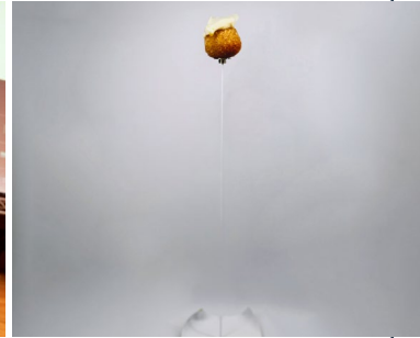
Mejor Pincho de la Provincia ha recaído en el Restaurante Bodega Mérida Wines de Mérida de Peñafiel y su "Equilibrio".